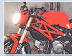
DSM-DUCATI MONO 1100