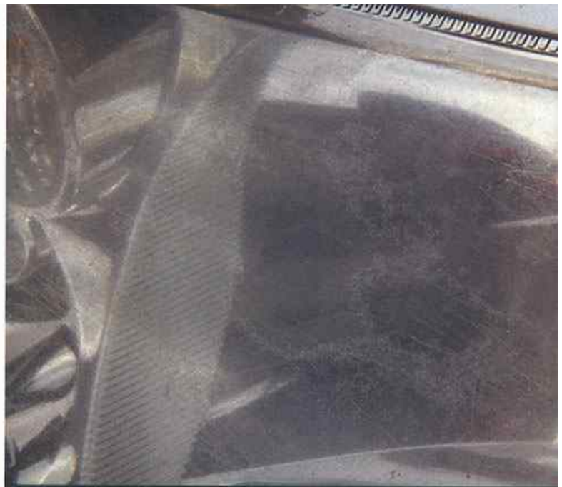
Blind und angefressen. Auch so trübe Kunststoffschelben werden wieder wie neu

Nachdem der Lack wieder glatt und glänzend ist, hilft eine Lackversiegelung, diesen Zustand möglichst lange zu bewahren. Die meisten Produkte sind sowohl für lackiertes Metall, wie auch für Kunststoffe geeignet. Unbehandelte Kunststoffteile benötigen aber meist eine besondere Behandlung und spezielle